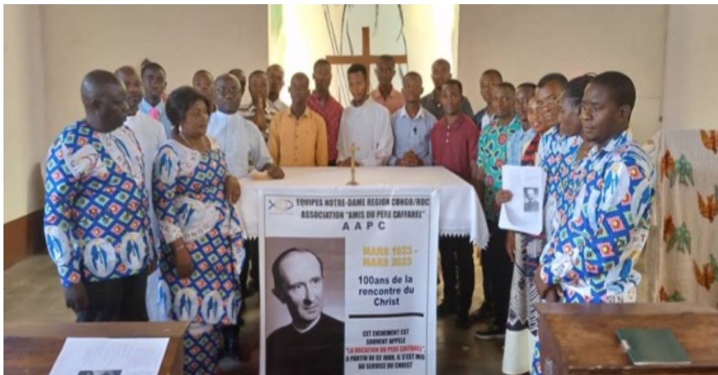
Celebração do 100 e aniversário da vocação do Padre Caffarel em Kinshasa – Região Congo