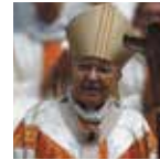
Cardeal André Vingt-Trois, arcebispo de Paris (França)

Arcebispo de Paris desde 2005, Ordinário dos católicos das Igrejas orientais residentes em França, foi criado cardeal pelo Papa Bento XVI em 24 de Novembro de 2007. É membro da Congregação para os Bispos, membro do Dicastério para o Serviço do Desenvolvimento Humano Integral e membro da Secção de Migrantes e Refugiados deste Dicastério. O cardeal André Vingt-Trois é também membro da Congregação para o Clero e da Congregação para as Igrejas Orientais.