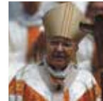
Cardinal André Vingt-Trois, archevêque de Paris (France)

Archevêque de Paris depuis 2005, Ordinaire des catholiques des Églises orientales résidant en France, il a été créé cardinal par le pape Benoît XVI le 24 novembre 2007. Il est membre de la Congrégation pour les Evêques, membre du Dicastère pour le service du développement humain intégral et membre de la section migrants et réfugiés de ce Dicastère. Le Cardinal André Vingt-Trois est également membre de la Congrégation du Clergé et de la Congrégation pour les Églises orientales.