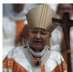
Cardenal André Vingt-Trois, arzobispo de París (Francia)

Arzobispo de París desde 2005, Ordinario de los católicos de las Iglesias orientales residentes en Francia, fue nombrado cardenal por el papa Benedicto XVI el 24 de noviembre de 2007. Es miembro de la Congregación para los Obispos, miembro del Dicasterio para el servicio del desarrollo humano integral y miembro de la sección de emigrantes y refugiados de ese Dicasterio. El Cardenal André Vingt-Trois también es miembro de la Congregación del Clero y de la Congregación para las Iglesias orientales.