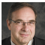
Mons. Jérôme Beau, presidente del Collège des Bernardins (Francia)

Vescovo ausiliare della diocesi di Parigi dal 2006. È stato ordinato prete per la diocesi di Parigi nel 1984. È titolare del master in Teologia. Mons. Jérôme Beau è presidente del Collège des Bernardins, responsabile della formazione e direttore della Ecole Cathédrale. È ugualmente direttore dell'Opera delle Vocazioni e presidente della Commissione Episcopale per i ministri ordinati e i laici in missione ecclesiale.