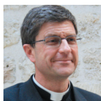
Mons Éric de Moulins-Beaufort (Francia)

Vescovo ausiliare della diocesi di Parigi dal 2006. È stato ordinato prete per la diocesi di Parigi nel 1984. È titolare del master in Teologia. Mons. Jérôme Beau è presidente del Collège des Bernardins, responsabile della formazione e direttore della Ecole Cathédrale. È ugualmente direttore dell'Opera delle Vocazioni e presidente della Commissione Episcopale per i ministri ordinati e i laici in missione ecclesiale.