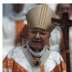
Cardinale André Vingt-Trois, arcivescovo di Parigi (Francia)

Arcivescovo di Parigi dal 2005, Ordinario dei cattolici delle Chiese Orientali residenti in Francia. È stato creato cardinale da papa Benedetto XVI il 24 novembre 2007. È membro della Congregazione per i Vescovi, membro del Dicastero per il servizio dello sviluppo umano integrale e membro della sezione migranti e rifugiati di questo dicastero. Il cardinale André Vingt-Trois è ugualmente membro della Congregazione del Clero e della Congregazione delle Chiese Orientali.